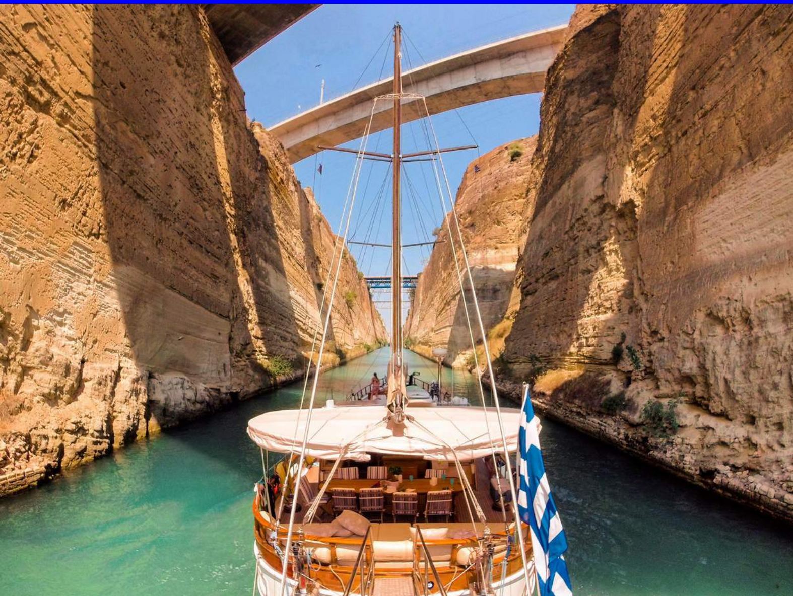
Traversée du canal de Corinthe lors de "L'Odyssée des 7 Merveilles"

L'air-conditionné fonctionne lorsqu'on est branché au port ou dans une marina avec prise de 32 A. On ne fait pas fonctionner le générateur toute la nuit en polluant les voisins (ET pollution sonore). Si c'est essentiel pour vous le capitaine adaptera l'itinéraire pour privilégier les marinas.